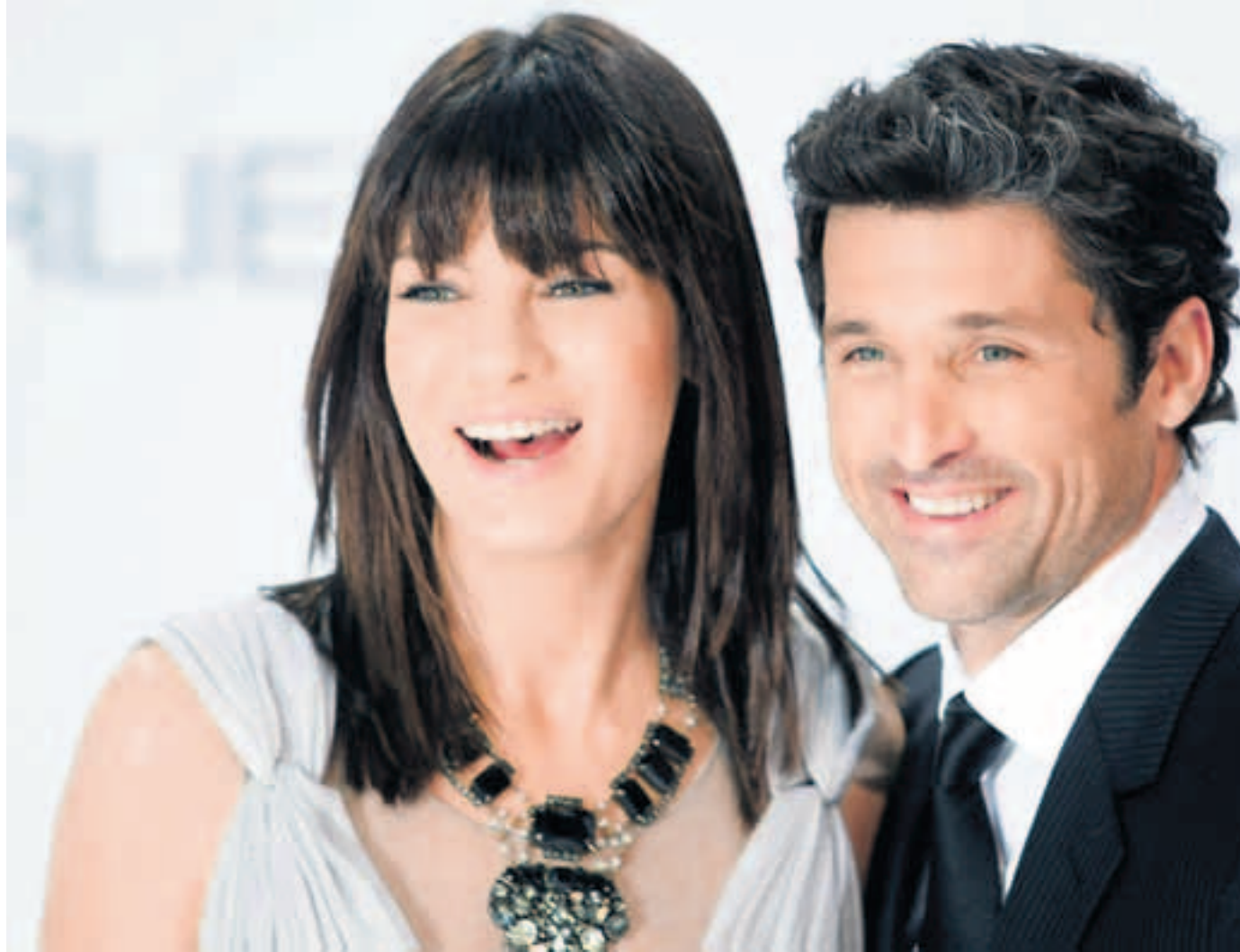
Liebeshändel in Schottland. An der Seite von Michelle Monaghan erprobte Patrick Dempsey, ob seine auf dem Bildschirm bewährte Attraktivität auch für die große Leinwand taugt. Gestern posierten beide auf dem roten Teppich für die Fotografen.

Dempsey gilt nicht erst seit seinem Durchbruch als Chefarzt als Frauenschwarm. „Make-Up ist der Schlüssel“, behauptet Dempsey, aber was soll er auch anderes sagen. In der Liste der „Sexiest Men Alive“ des Magazins „People“ hat er es jedenfalls drei Mal hintereinander auf Platz zwei geschafft, jedes Mal nur knapp geschlagen von Matt Damon, Matthew McConaughey beziehungsweise George Clooney. Mit letzterem wird Patrick Dempsey oft verglichen – auch deshalb, weil der „Ocean's“-Star einst selbst durch eine Arztserie berühmt wurde – als Dr. Douglas Ross in „Emergency Room“. Nach 106 Folgen stieg