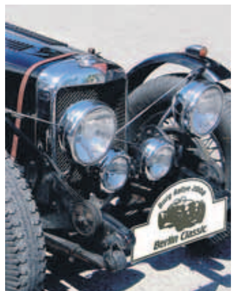
Hochglanzpoliert. Die Oldtimer-Szene macht wieder mobil.

Noch vor wenigen Monaten schienen Veranstaltungen wie diese nicht länger möglich: eine Oldtimer-Rallye, die auch durch die Berliner Innenstadt führt, hier womöglich sogar startet und endet. Erst dank der Ausnahmeregelung für Fahrzeuge mit H-Kennzeichen, die also mindestens 30 Jahre auf dem Buckel haben, konnte die Szene der Freunde für historisches Blechspielzeug aufatmen – und weiterhin mit City-Fahrten liebäugeln, wie sie am 24. Mai als „Burg Rallye 2008