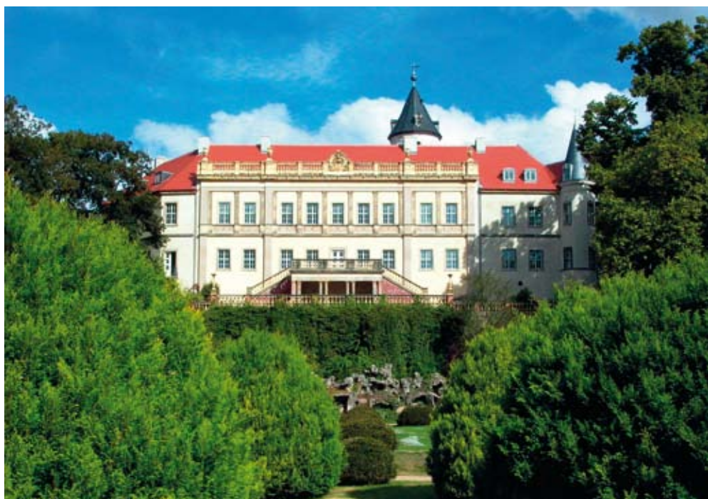
Südfassade von Schloss Wiesenburg

Zeit und Platzierung, Beständigkeit und die Fähigkeit, zu können.“